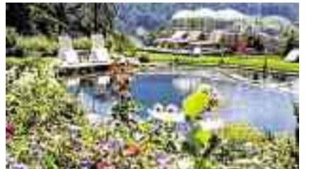
Wellness in den Alpen: Reisen Sie nach Sölden.

den Alpengasthof Grüner . Sie gewinnen: Ein Woche Urlaub zu zweit (6 Nächte) inklusive Verwöhnungspension. Dazu freien Zugang zum AlpenSpa, geführte Wandertouren und Leih-Mountainbikes. Wer bis 12. Oktober anreist, bekommt die „Ötztal Premium Card“ mit vielen Eintritts-Tickets dazu. Der Gutschein gilt ab 27. Juni 2014 für ein Jahr (je nach Verfügbarkeit, ausgenommen Weihnachten und Silvester). Gesamtwert: rund 2000 Euro.