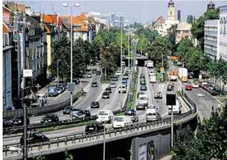
Brutale Schneise: Die Landshuter Allee schneidet Neuhausen in zwei Hälften, sorgt für Lärm und Dreck.

Was ist los in Ihrem Viertel? Täglich in der Abendzeitung und im Internet auf az-muenchen.de/stadtviertel